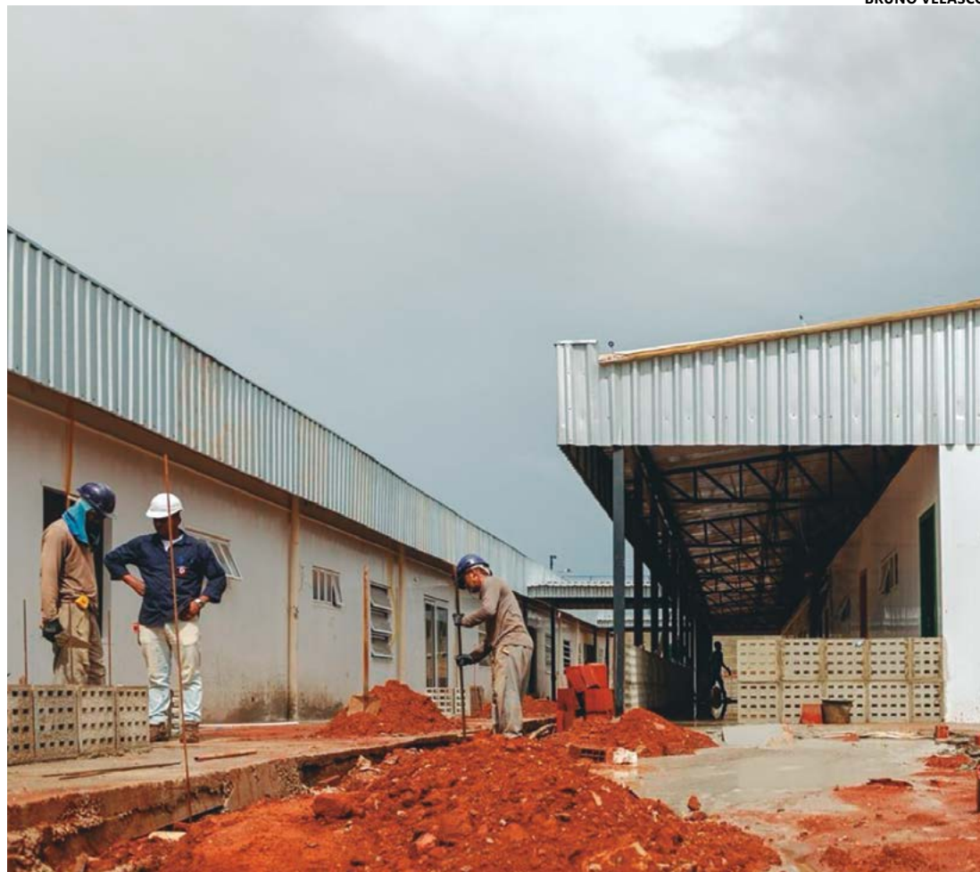
Entre os projetos em construção está o CMEI do Parque dos Pirineus, que já tem 93% da obra concluída