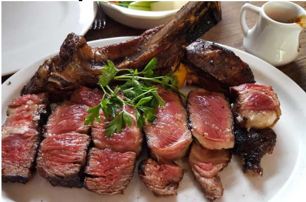
Costela de Manzo ai Ferri: Giullietta carni all'italiana, restaurante italiano localizado em São Paulo

Diferentemente de exageros cometidos esporadicamente durante algumas refeições, a compulsão alimentar, definida pela Organização Mundial da Saúde (OMS) como um distúrbio caracterizado por ingestão exagerada de alimentos em curto intervalo de tempo, sem que haja fome ou necessidade física, atualmente atinge 4,7% da população brasileira, quase o dobro da população mundial, com cerca de 2,6%. De acordo com Cintya Bassi, coordenadora de nutrição e dietética do São Cristóvão Saúde, em exageros casuais, “é possível controlar o comportamento e a alimentação, para evitar a fome em horários indevidos e melhorar as escolhas”.