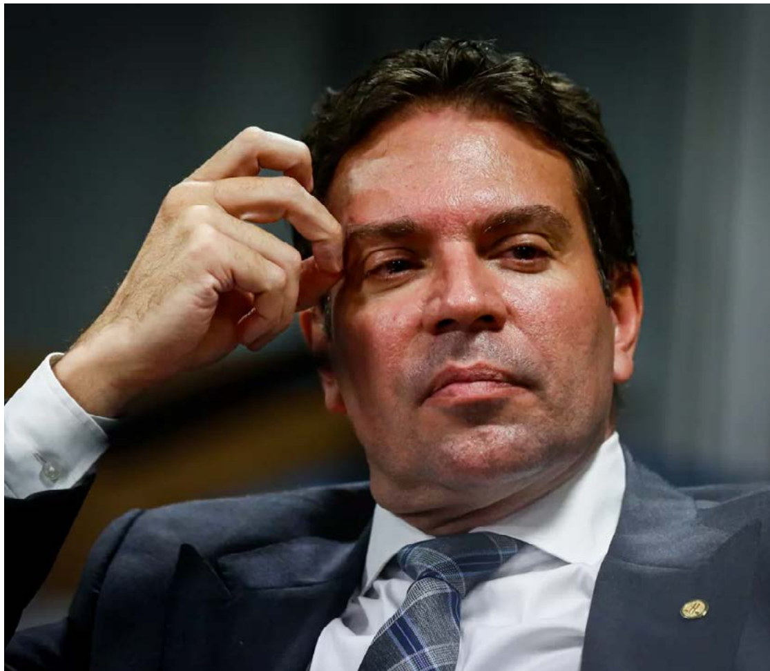
Deputado federal Alexandre Ramagem (PL-RJ), ex-diretor da Abin: investigação da PF

porque, segundo a PF, teria autorizado investigações paralelas, sem autorização judicial e sem indícios mínimos de materialidade que justificassem as apurações. Procurado pela reportagem, ele ainda não se manifestou.