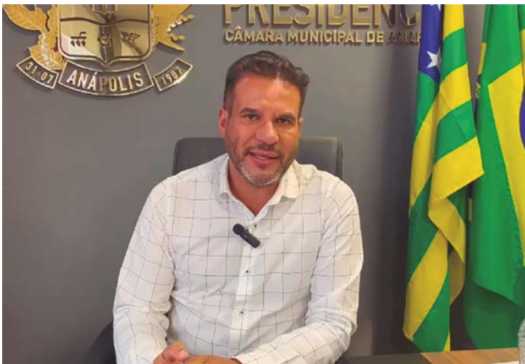
Domingos: “situação já está chegando num ponto insustentável”

O DM Anápolis mostrou, em reportagem publicada na segunda-feira, 22, que um portal de notícias da cidade divulgou áudio vazado, atribuído ao vereador Delcimar Fortunato, no qual revela que, por sua influência, na campanha eleitoral de 2022, teria intermediado junto ao então candidato ao Senado, Marconi Perillo (PSDB), destinação de recursos financeiros para um grupo de vereadores. No áudio em questão, a voz atribuída a Fortunato cita como beneficiários os vereadores Cabo Fred Cai-xeta (Avante), Thais Souza (PP), Cleide Hilário (Republicanos), João da Luz (PSC) e Luzimar Silva (Mobiliza). Todos eles negam veementemente que receberam algum dinheiro do colega.