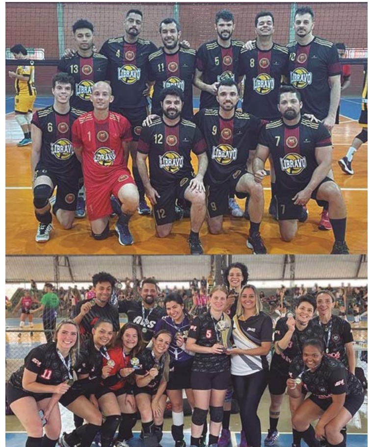
Equipes do projeto criado pelo educador físico Júnior Nogueira conquistaram bons resultados em competições e também fora delas