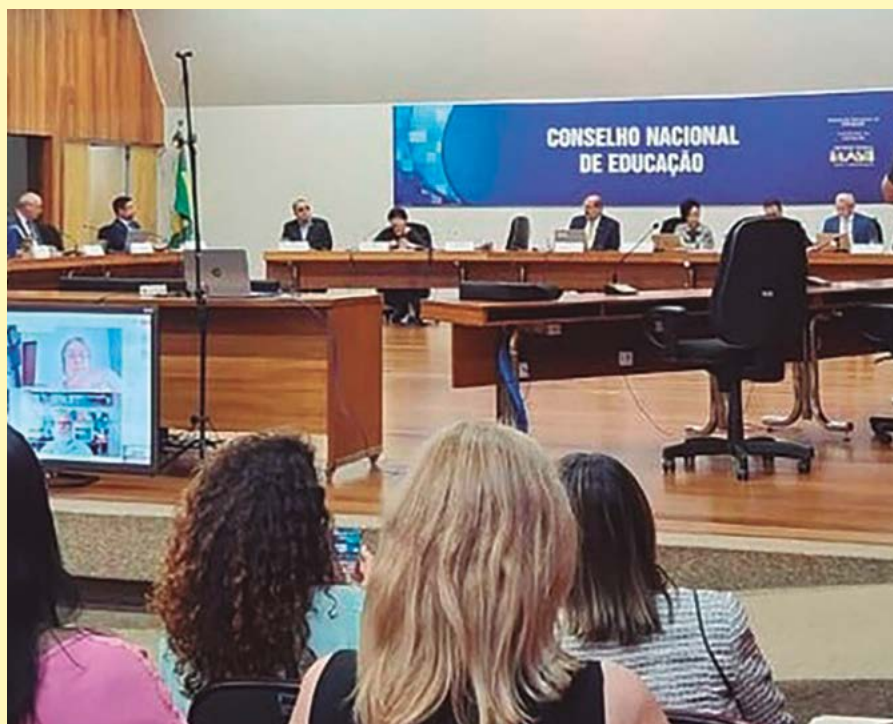
Reunião do Conselho Nacional de Educação, feita em Brasília, com participação do MPGO

O Parecer nº 50/2023, do CNE/CP, que trata de orientações específicas para o público da Educação Especial: Atendimento de Estudantes com Transtorno do Espectro Autista (TEA), foi um dos itens da pauta dos debates realizados durante a reunião. Outro Parecer, de nº 51/2023, também deba-