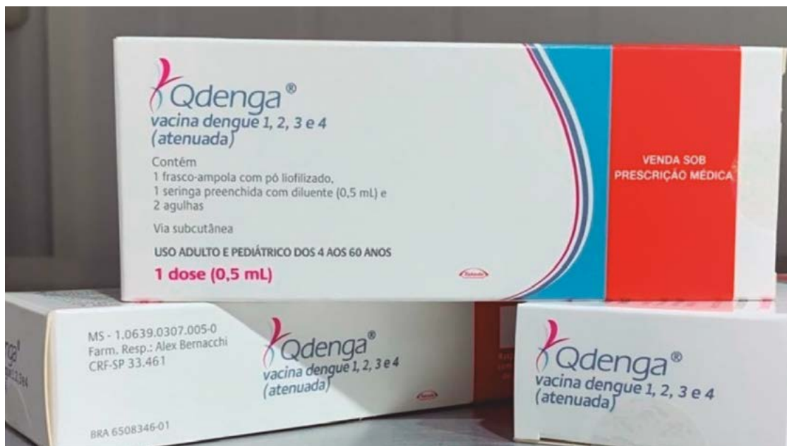
Vacina Qdenga: número total de doses a serem enviadas à cidade não foi divulgado pelo governo federal

O problema, no entanto, é que são necessárias duas doses – numa janela de três meses – para cada pessoa para a imunização, ou seja, o contingente poderia proteger pouco mais de 3,2 milhões de brasileiros con-