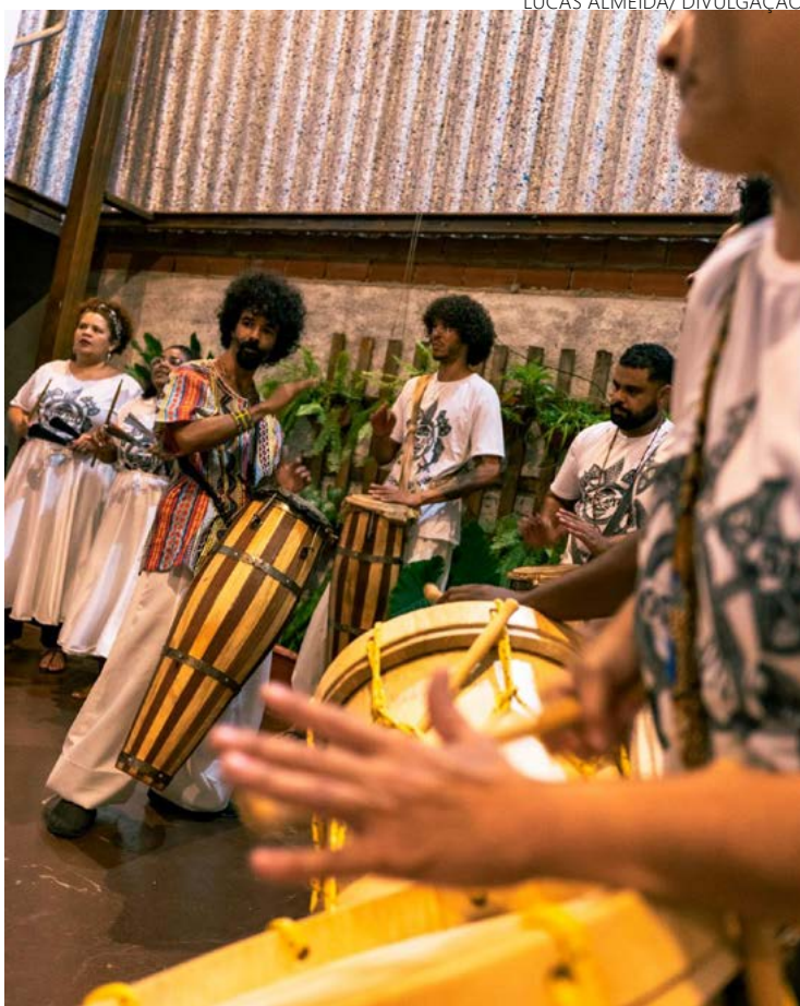
Percussão: bloco apresenta ritmos africanos