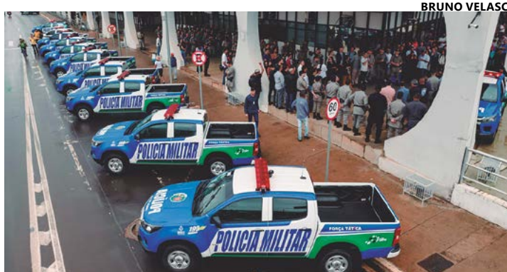
Nova frota entregue dentro do programa 'Força Tática', fruto de parceria entre Prefeitura de Anápolis e Governo: essencial para garantir segurança

A eficácia da política de segurança pública implementada pelo Governo de Goiás pode ser exemplificada pelos resultados obtidos na Operação Desmantelo, realizada pela Polícia Civil, por meio da Delegacia de Repressão a Furtos e Roubos de Veículos Automotores (DERFRVA), Polícia Científica e Polícia Rodoviária Federal (PRF), que resultou na prisão de 20 pessoas, suspeitas