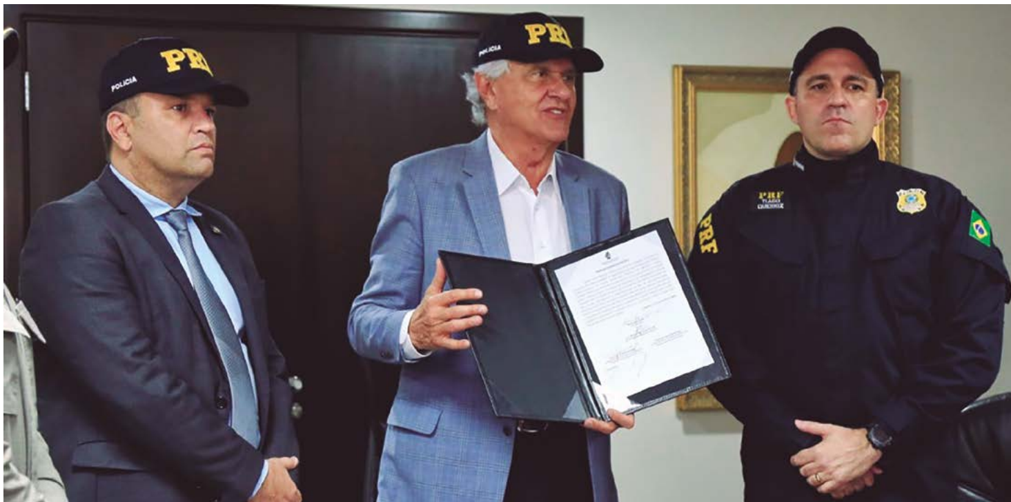
Governador Ronaldo Caiado durante solenidade de assinatura do termo de cooperação técnica com a Polícia Rodoviária Federal, em dezembro