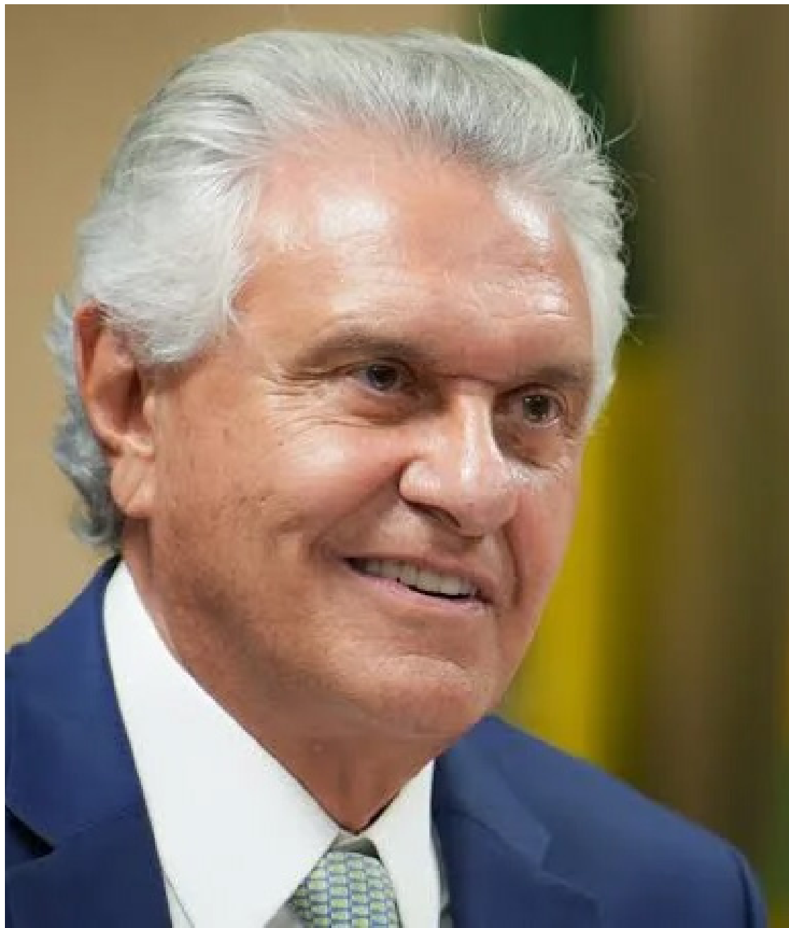
Ronaldo Caiado: popularidade entre governadores o projeta na política nacional

Caiado disse que a polícia em Goiás é totalmente integrada e tem, inclusive, centro de inteligência das polícias estaduais dentro da unidade da Polícia Federal. “Também não