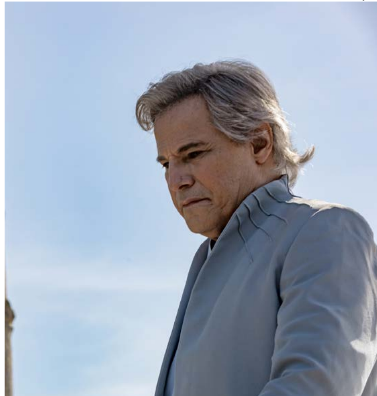
Rosto conhecido: Edson Celulari atua na sequência do filme “Nosso Lar”