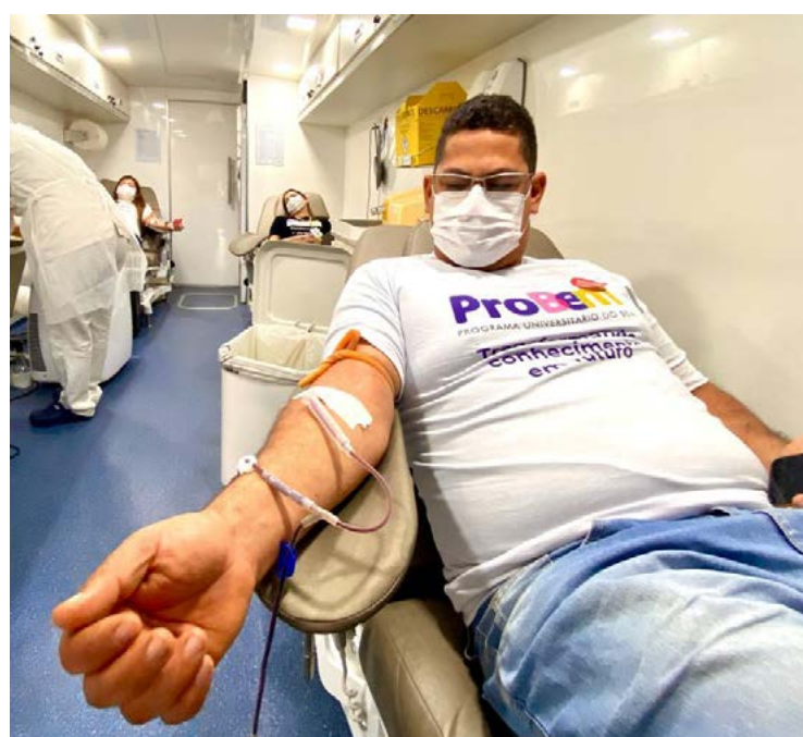
Cada doação beneficia até quatro pacientes, informa a Rede de Serviços Hemoterápicos de Goiás

Se você tem entre 16 e 59 anos e quer se tornar um doador, procure o banco de sangue mais próximo munido de documento com foto válido em todo o território nacional. Para fazer a doação, é necessário estar saudável e pesar acima de 50 kg. Já os beneficiários do ProBem devem agendar a doação com antecedência por meio Banco de Oportunidades (sistemas.ovg.org.br/bolsistas/). É importante que o doador tenha tido um boa noite de sono, não esteja em jejum e que se hidrate bem antes da doação.