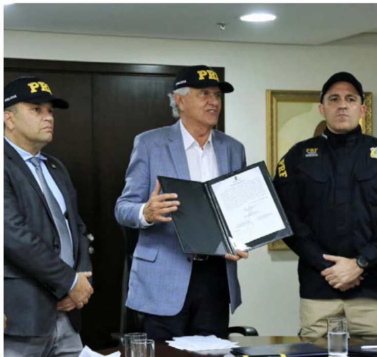
Ronaldo Caiado durante assinatura do termo de cooperação com a PRF, em dezembro: integração melhora eficiência

Ontem as equipes policiais cumpriram mandados de pri-